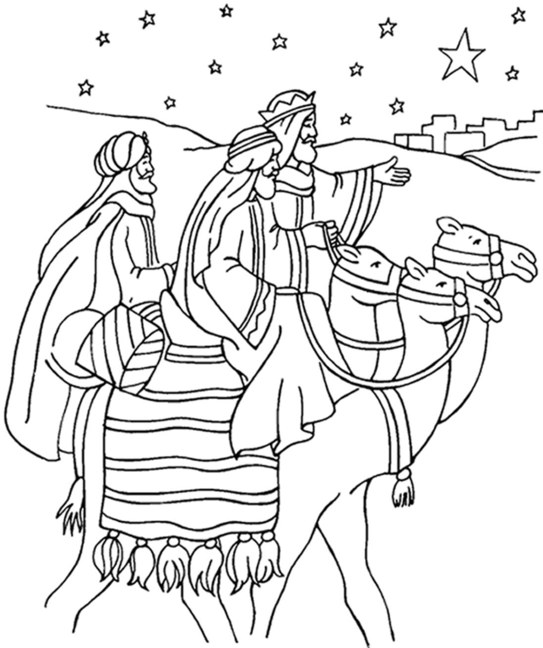
Wise Men Worship Jesus Matthew 2

From Thru-the-Bible Coloring Pages for Ages 4-8. ©1986,1988 Standard Publishing. Used by permission. Reproducible Coloring Books may be purchased from Standard Publishing, www.standardpub.com, 1-800-543-1301. Sermons4Kids.com