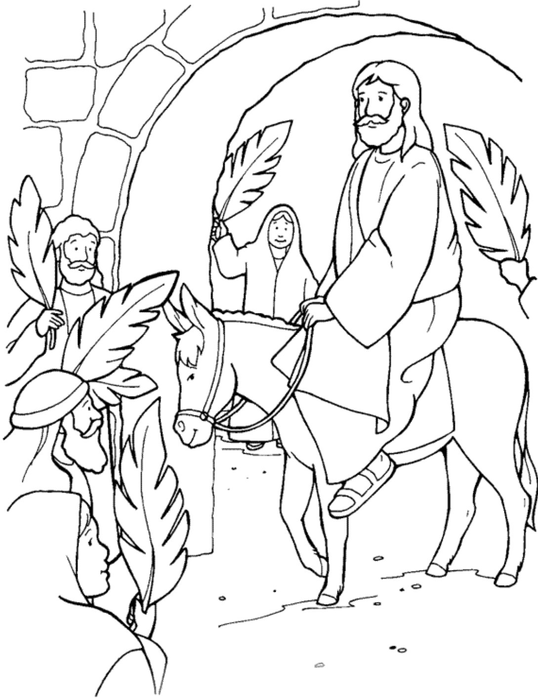
Jesus Rides into Jerusalem on a Donkey