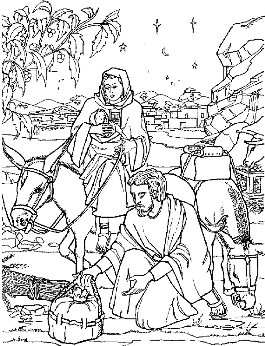
Mary, Joseph and Baby